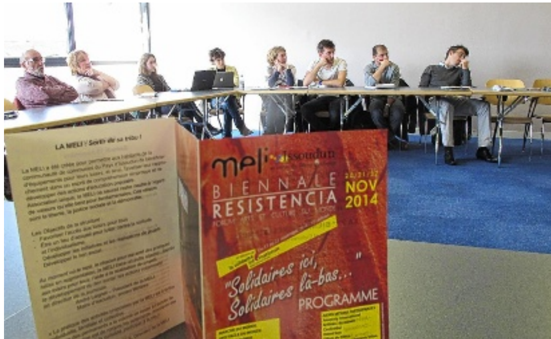
Une vingtaine de personnes participait à cet après-midi de conférences.

L'idée de renforcer l'agriculture familiale pour nourrir les villes fait son chemin. C'est d'ailleurs dans un souci de nourrir plus de personnes que l'association is-